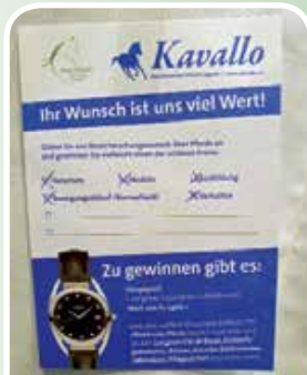
Wettbewerb – Qual der Wahl