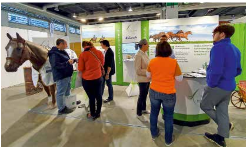
Der Stand von Pro Pferd ist gut besucht.