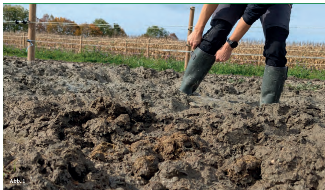
Abbildung 1: Die Versuchsanlage in Saint-Aubin.

Moderne Pferdehaltungsformen trennen Flächen in verschiedene Funktionsbereiche, was die Tiere zu Bewegung motiviert, Tiergesundheit und Zusammenleben in Pferdegruppen fördert. Paddock Trails setzen das erwähnte Prinzip um, indem die Funktionsbereiche weit entfernt voneinander angelegt und durch Laufgänge verbunden sind. Das notwendige Befestigen von ganzjährig genutzten