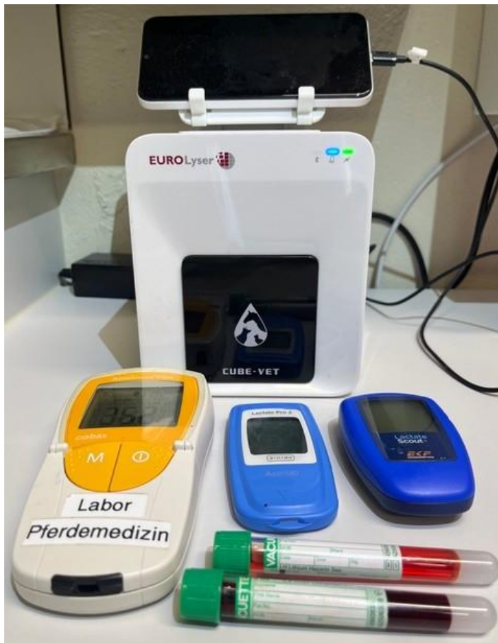
Abbildung 1: Die 4 POC-Analysegeräte, die verglichen werden. Im Vordergrund von links nach rechts der Accutrend Plus, der Lactat 2 Pro, der Lactate Scout+ und im Hintergrund der Eurolyser CUBE-VET. Vorne liegen eine heparinisierte Blutprobe und ein heparinisiertes Bauchhöhlenpunktat.

Die Laktatkonzentration im Blut als auch in der Bauchhöhlenflüssigkeit lag zwischen 0 und 25 mmol/L.